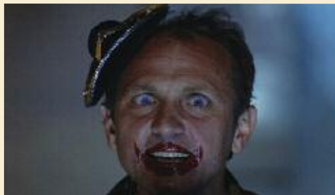
(A)pollonia © Stefan Okolowicz