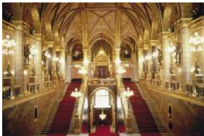
Budapest's House of Parliament