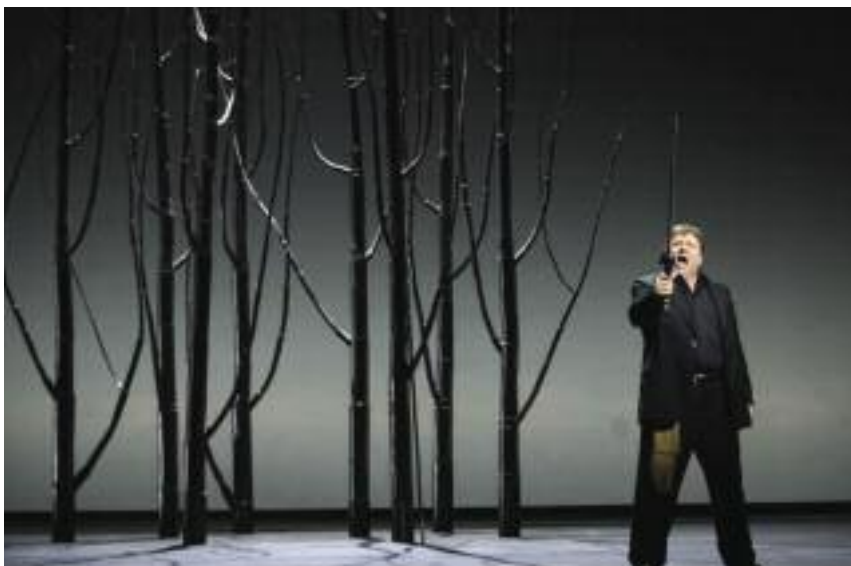
Ben Heppner in Götterdämmerung