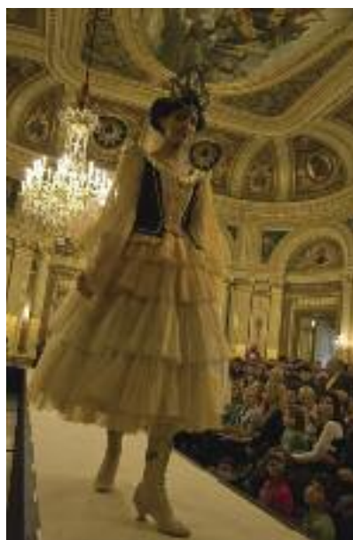
EOD 2009 in Bordeaux