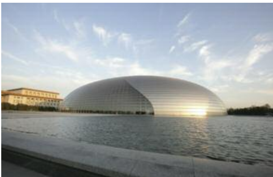
The NCPA shell-like structure

China is justifiably proud of its National Centre for the Performing Arts in Beijing. Within the first year and a half of its existence, it has succeeded in transforming the supply of opera and dance, music and theatre in this vibrant and developing capital city. Its imposing shell structure, surrounded by an artificial lake, houses three auditoria: an opera house seating 2,398; a concert hall seating 2,019; and a theatre holding 1,035. When the mini-theatre for 550 is opened later this year, there will be 6,000 available places, plus spacious surrounding areas for free educational events and exhibitions, a resource centre, and shops and cafés, collectively known as 'the Fifth Space'.