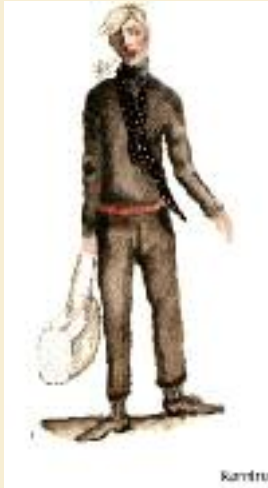
Costume design for La finta giardiniera