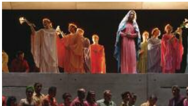
Fidelio