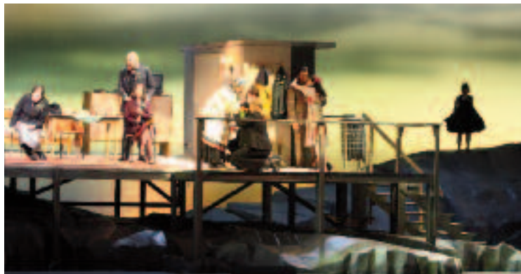
Jenůfa © Wilfried Hösli

examining what is the purpose of opera today and an opera company's responsibility towards the public before making way for a keynote address from an eminent outside speaker. The evening will conclude in the traditionally convivial surroundings of the Hofbräuhaus.